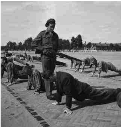
Gedetineerde NSB'ers in Kamp Vught, 1945.