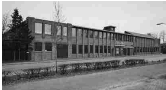
Karel I-sigarenfabriek, 1997.

Gealarmeerd door de berichten laat generaal Kruls eind oktober een onderzoek instellen. Hij is, na zijn bezoek aan Kamp Reusel van mening dat in Reusel minstens 40% er ten onrechte zit opgesloten en informeert de in Londen verblijvende minister van Justitie Van Heuven Goed-