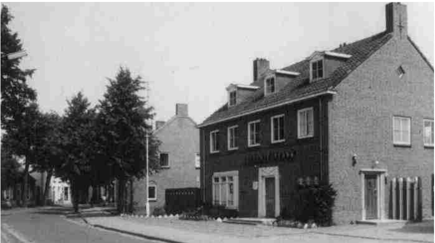
Aan het eind van de Markt, bij het begin van de Dijk, had de Boerenleenbank voor het eerst een eigen gebouw. (ca. 1958?)