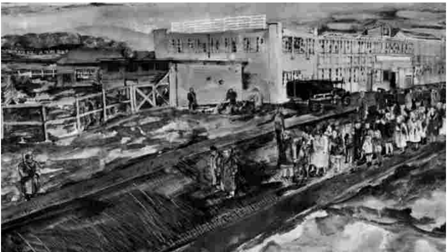
Rijen mannen, vrouwen en kinderen onder toezien oog van gewapende personen. Op de achtergrond Kamp Reusel, 1944. (War Artist Albert Richards, Collectie IWM)