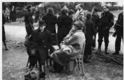
Aankomst 22 oktober 1944.