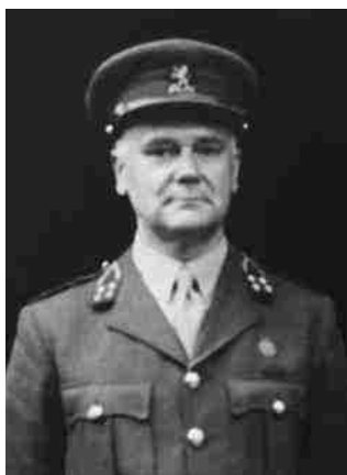
Generaal Kruls, 1946.

hart. Noodzakelijk is, volgens hem, een snelle zuivering van de politie en dat de handhaving van orde en rust samen met het Militair Gezag wordt opgepakt. Terwijl op dat moment de Binnenlandse Strijdkrachten dat doen. De minister krijgt van Kruls ook te horen dat baby's "gemakshalve in een paar margarinekistjes" zijn meegenomen omdat de ouders geen kans zagen ze door derden te laten verzorgen. Van Heuven Goedhart is toen, zo vertelt hij later aan de Enquêtecommissie, "zo bijzonder kwaad geworden dat ik ... een klap op de ministerstafel heb gegeven en heb gezegd: Dit is schandelijk en nu wil en zál ik naar bevrijd gebied, want ik neem dit geen moment voor mijn rekening" (Koninkrijk der Nederlanden 10a). Voor de circa 1500 bewoners, waaronder 500 vrouwen en 100 kinderen, zijn er slechts 700 dekens. Niet meer dan 10% is in het bezit van verschooning en de voeding is eerst op orde nadat de centrale keuken in Eindhoven de voeding gaat verzorgen.