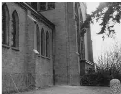
Hier hebben de soldaten tijdelijk een laatste rustplaats gehad

Op de dag van onze bevrijding zagen we 's avonds lichtkogels boven Eindhoven hangen. Later bleek dat de Duitse Luftwaffe de pas bevrijde