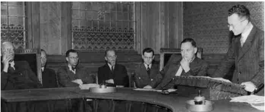
Eerste zitting Tribunaal Bijzondere Rechtspraak in Den Bosch betrof een NSB'er veroordeeld tot zes jaar gevangenis, 25 juli 1945.

Overbevolking zou tot de zomer van 1946 een groot probleem blijven. Het tekort aan materiaal bleef. Eerst na midden 1946 verbeteren geleidelijk de omstandigheden. Op 1 januari 1946 zijn er van de 130 nog 106 kampen in gebruik. Een jaar later zijn er dat 68. Maar ook dan zijn er geen uniforme inrichtingen en regels. Nog steeds zijn er hier en daar geen kribben en slapen de gevangenen op stro. In verscheidene kampen is de hygiënische situatie nog altijd niet voldoende. Warm water ontbreekt soms en in bepaalde kampen zijn geen toiletten maar wordt nog met het tonnetjes-