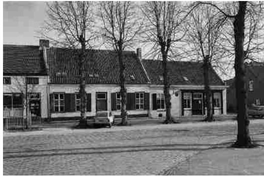
Markt 18 - 22