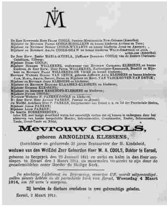
Deze zeer uitvoerige rouwbrief van Arnoldina Klessens, in de deftige stijl die men in België ook nu nog wel eens aantreft. De familie in de ruimste zin deelt het overlijden mee. Mevrouw Cools is de weduwe van dokter Cools.