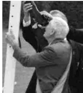
Zelf het eerste schot lossen

Het Steenselse gilde wilde al bij aanvang niet dat Dries van Agt zich verplicht zou voelen om steeds bij alle activiteiten aanwezig te zijn. Dit blijkt ook onmogelijk te zijn wanneer Van Agt na zijn carrière als minister-president eerst Commissaris van de Koningin in Noord-Brabant en later de speciale afgezant van de EU in Japan wordt. Dezelfde functie voert hij daarna nog jaren uit in de Verenigde Staten, zodat hij vrijwel niet meer in Nederland is. De relatie raakt wat in een slop.