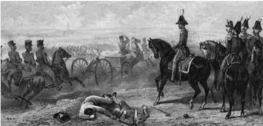
Slag bij Leuven

Tolsma raakt gewond op 12 augustus. Met in het zicht Leuven wordt men, ongedekt en in de nabijheid van vijandelijk geschut, onder schot genomen door 12- en 14-ponders. Verward trekt men zich terug. "Op deze kleine retraite werd, -behalve eenige schutters, die gekwetst werden of sneuvelden,- den 2den luitenant der 6de compagnie Tolsma door een 12 ponder, welke zijne kracht reeds had verloren, den arm geblesseerd, zoodat hij tot eene ongelooflijke dikte opzwol". Aldus Cannegier in Grootvader's Glorie. Het metalen kruis zal hem worden toegekend. Diezelfde vrijdag dag was bij de strijdende partijen de schikking met de toekijkende grote mogendheden doorgedrongen dat de volgende dag de stad ontruimd zou zijn zodat de Nederlanders, symbolisch, de stad zouden kunnen binnentrekken om vervolgens, 'eervol', terug te keren naar de overzijde van de demarcatielijn. Einde strafexpeditie.