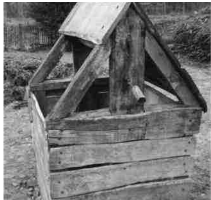
Waterput en mestvaalt op een erf in openluchtmuseum Bokrijk

Donkersloot beschrijft in zijn Schetsen uit het kantonnementsleven in Noord-Brabant (1830-1835) onder andere 'Het testament van een oud soldaat'. Soldaat J.H. Br. had met potlood op de blanke bladen van een verouderde almanak zijn laatste wil geschreven. "Een soldaat een testament?", vraagt hij zich af. Hij had zijn vader nooit gekend en was op jonge leeftijd door zijn moeder in het leger achtergelaten, om vervolgens als tamboer opgevangen te zijn en later gepromoveerd tot soldaat 30 jaren dienst te doen. Al die tijd had hij zuinig geleefd en behalve wat persoonlijke bezittingen honderd gulden te vermaken, en wel aan de diverse leden van zijn compagnie. Wat hemzelf betreft voor de barbier geld om een scheermes te kopen om hem te scheren: alleen het haar en niet de huid! En ter bekostiging van een be-