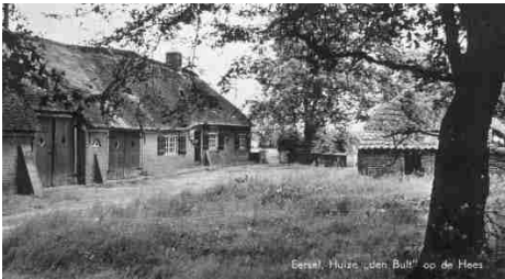
Huize "den Bult" op de Hees