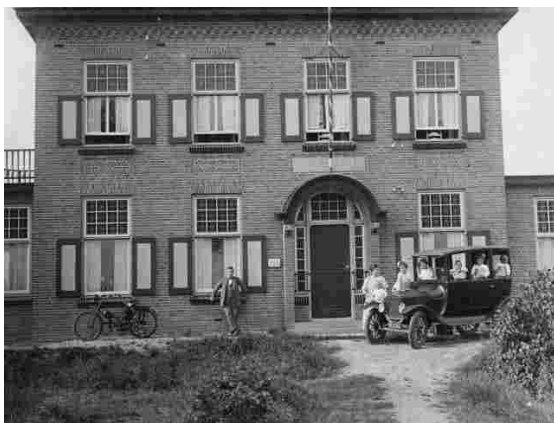
Dokter Vissers voor Sonnevanc, de kinderen in zijn auto.

Dokter Vissers - geboren op zondag 12 mei 1889 in Haarlem - was een echte dorpsdokter. De omstandigheden waren in die tijd natuurlijk ook heel anders . Snelle verbindingen ontbraken en het was bittere noodzaak om alle medische klusjes zelf op te knappen. Zo vervulde hij ook regelmatig de functie van tandarts; oud Eerselenaren herinneren zich nog goed dat hij niet schroomde de grenzen van zijn mogelijkheden op te zoeken