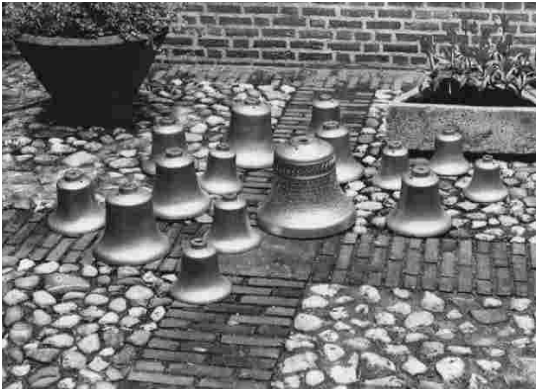
Een aantal klokken op de patio van het oude gemeentehuis. Nee, het zijn er geen 18!