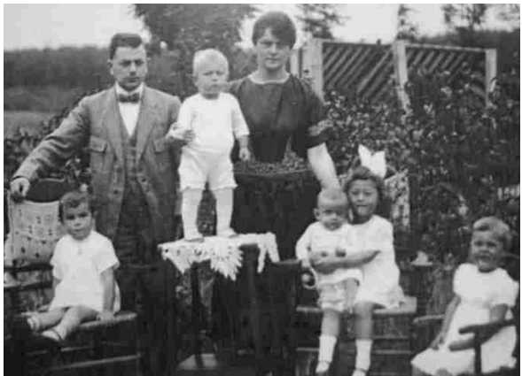
Echtpaar Vissers en hun 5 kinderen.