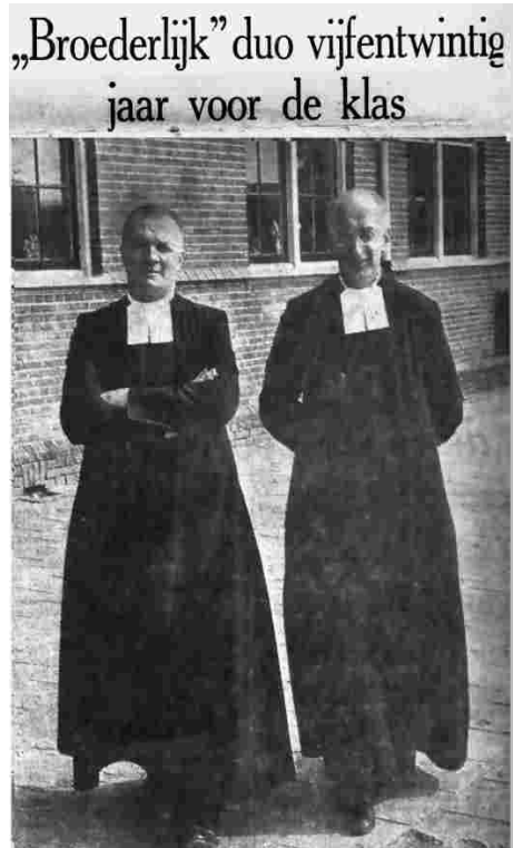
Het oude knipsel uit de Nieuwe Haarlemmer Courant van 1962.

Jean-Baptiste de la Salle sticht er dan zijn Fratres Scholarum Christianarum, Broeders van het Christelijke Onderwijs, kortweg FSC en ook wel Broeders van La Salle. Deze wijdden zich wereldwijd inzetten voor onderwijs, met name voor goed volksonderwijs. Aan de minder bedeeden dus.