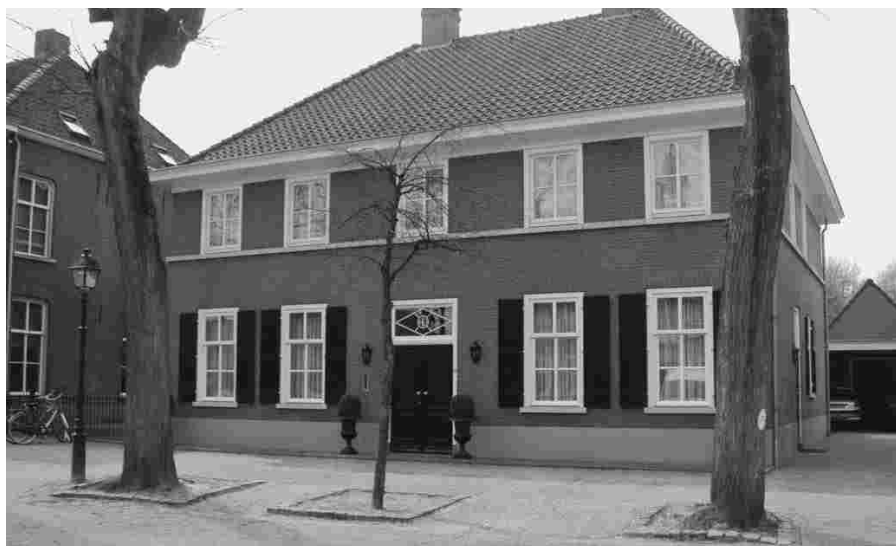
Huidig pand Markt nr. 19