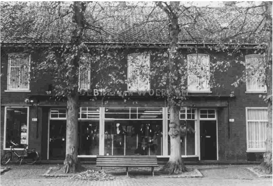
Het bekende en vertrouwde pand aan de Markt.