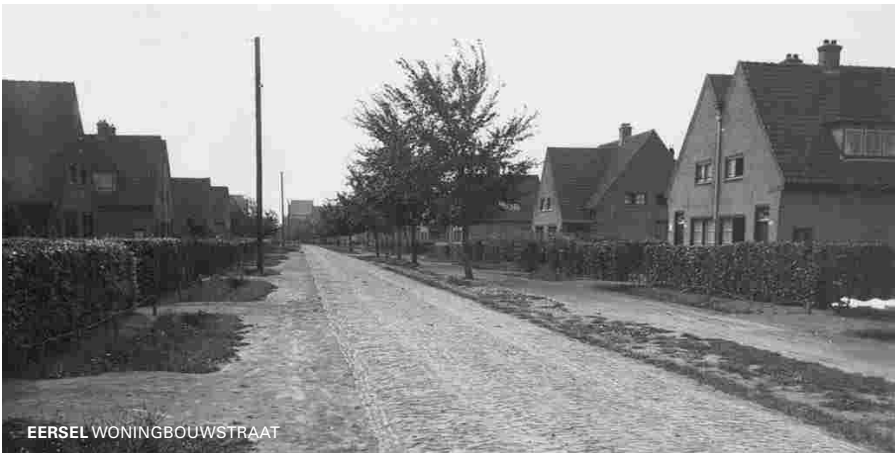
De Willibrorduslaan heette ca. 1925 Woningbouwstraat en was daarvoor mogelijk bekend als Lijkweg.

In Eersel liep, zoals gezegd, de lijkweg ter hoogte van de Willibrorduslaan en werd vóór 1920 mogelijk ook nog zo genoemd. (De huidige Willibrorduslaan heette vanaf ca. 1925 eerst Woningbouwstraat).