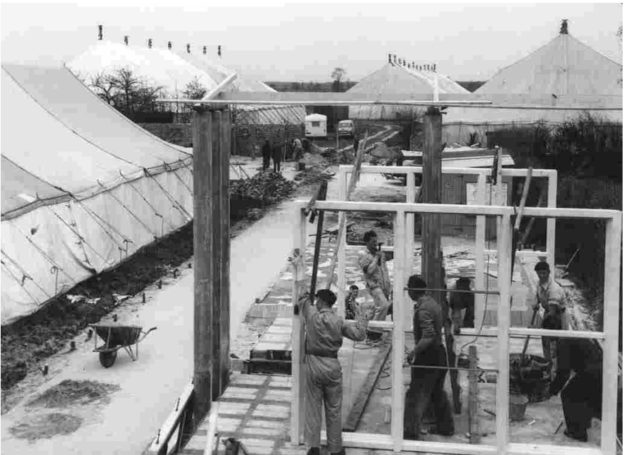
Volop bedrijvigheid bij het opzetten van de tenten voor de tentoonstelling OK 2.

Ook was het traditie dat tijdens de kermis een concours-hippique georganiseerd werd door de plaatselijke ruitelij in de weien achter zijn huis. In de annalen van de Goede Hoop lezen we b.v. op 18 november 1934 dat de harmonie aanwezig zal zijn bij het bezoek van minister Marchant aan de landbouwtentoonstelling in Eersel en dat harmonie De Goede Hoop 6 concerten zal verzorgen. De ingang naar de tentoonstelling was via de ingangspoort van de harmoniezaal.