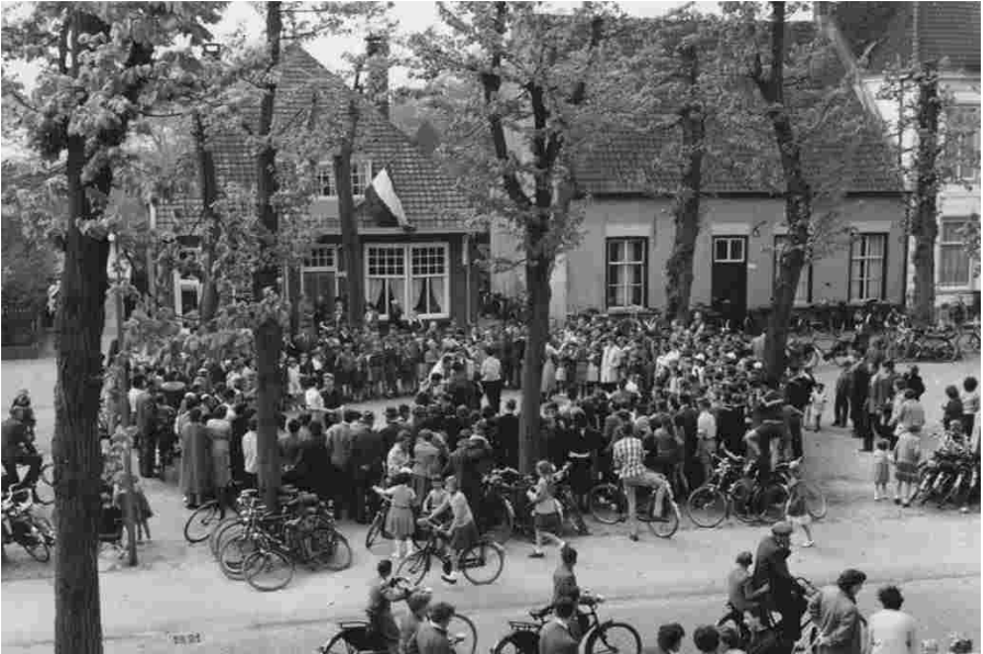
Voormalig pand van Neliske Jacobs

die ook allen een specifiek beroep hadden zoals smid, monteur, opzichter en landbouwknecht. Het moet daar op de Markt nummer 19 derhalve een levendige zaak zijn geweest.