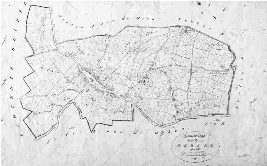
Kaart van sectie F uit 1832 van de kadastrale gemeente Eersel (coll.Rd)

Hees, Dijken, Heibloem, Kortkruis, Lage Heide, Schadewijk en Stokkelen. Op het gemeentekaartje dat Kuijpers van Eersel omstreeks 1865 maakte, staat één "Straat- en Kunstweg" genoemd. Die verharde weg verbond de dorpen van de Kempen en heette hier, maar ook elders, (de) Nieuwstraat. De Voortsche Dijk, de Heestertsche Dijk, nu de Postelseweg, en De Kromme Molenweg zijn erop vermeld als "gewone weg". Toch waren dat allemaal zandwegen en zandpaden. Wegen zoals wij die nu gewoon vinden, verschijnen - zeker op het hele platteland - pas vanaf ongeveer 1900. Notariële akten van koop en verkoop en andere belangrijke gebeurtenissen, zoals 'scheiding en deling' na overlijden zijn van alle tijden. Het vastleggen van namen is echter eeuwenlang niet erg nodig geweest : men was weinig mobiel en "iedereen wist immers wel waar het over ging". Daar komt langzamerhand toch verandering in. Een eerste teken daarvan is in 1885 een Wegenlegger van Eersel, een document waarin de dan in de gemeente gebruikelijke benamingen officieel worden vastgelegd 4 . Een 'legger' doet dit volgens een vast patroon.