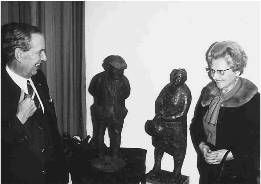
Tijdens de opening van het bankkantoor op 30 oktober 1969 heeft de ABN het beeldje van de pronte vrouw geschonken aan de gemeente.

Het was in 1995 dat de directie van de ABN bank in Eersel besloot het op nummer 19 aan de Markt gelegen kantoor te verlaten en in de verkoop te doen. De reden was de fusie van de ABN met de AMRO-bank, met als gevolg een speurtocht naar kostenbesparingen. Het was vrij snel duidelijk, dat het huidige kantoorgebouw niet meer paste in het totale kostenplaatje en er geen plaats was voor twee banken in een relatief klein dorp als Eersel. De combinatie betrok een verbouwd pand op de kop van de Willibrorduslaan en deed het ABN kantoor op de Markt in de verkoop.