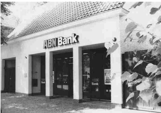
Het voormalige pand van de ABN Bank aan de Markt 19 te Eersel.