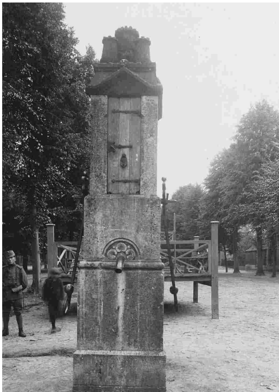
De eerste "kiosk" was niet veel meer dan een verhoogd plateau voor een nog zeer beperkt muziekgezelschap. Met de militair is de afbeelding vrij nauwkeurig te dateren: ca. 1914-18.