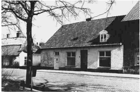
Verdwenen schoolhuis tegen oude school