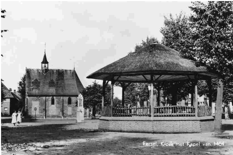
Eersel, Kiosk met Kapel van 1464

Voor mijn gevoel waren er vroeger “overall” muziekkiosken. Dat was zeker zo in mijn geboorteplaats Tilburg waar er inderdaad diverse stonden. Maar ook in de dorpen die ik toen kende, was dat niet anders. Dat beeld van die vanzelfsprekende aanwezigheid van een muziekkiosk veranderde niet toen ik in de Kempen ging wonen. Nog steeds waren er “overall” kiosken: in Eersel, Bladel, Bergeijk, Hapert... Soms zelfs nog vrij jong: vierde niet onlangs Duizel het tienjarig bestaan van zijn muziektempeltje op het Smisplein?