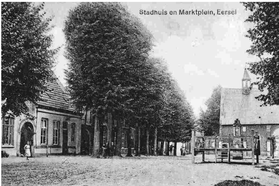
Het eerste, nog niet overdekte speelplatform zoals dat omstreeks 1915-20 op de Markt stond.

Het moeten er ook in ons land heel wat geweest zijn. Hoeveel precies is nooit geteld en ook nu nog heeft de Rijksdienst voor Cultureel Erfgoed geen idee van het huidige aantal 2 . Het is 'verdwijnd cultuurogoed' als het al niet verdwenen is. Er is duidelijk minder emplooi voor deze vorm van amusement, er is vandalisme en de hoge onderhoudskosten maken het voor gemeenten weinig aantrekkelijk om een muziekkiosk in stand te houden. Zo kunnen ze hier of daar bijna onopgemerkt verdwijnen. Elders ontstaan echter ook krachtige initiatieven om een kiosk terug te brengen waar die ooit stond of die juist te behouden, zoals onlangs in Luijkgestel.