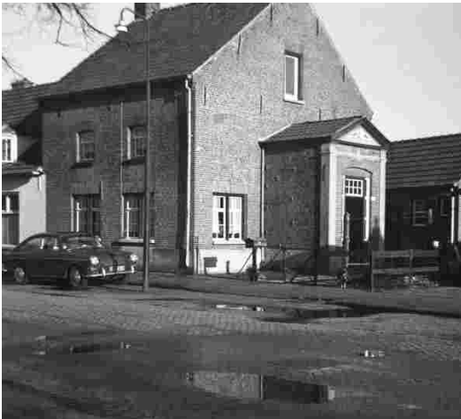
Oude school aan Joseph Schulteweg