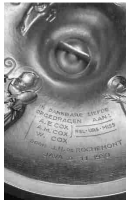
De massief vergulde torenmonstrans (l) met inscriptie onder de voet, schenking aan de nieuwe Steenselse kerk in 1930