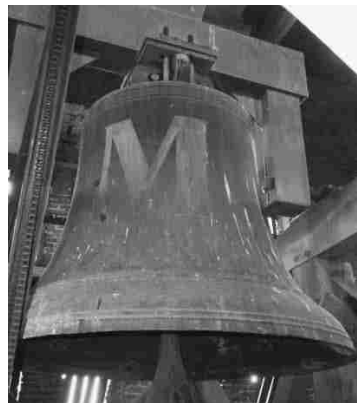
Lucia-klok in de toren met M van monument

Arbo-technisch onverantwoord en daarom heeft de gemeente als eigenaar nu een plan uitgevoerd om die situatie te verbeteren. Want monumentenwacht, houtinspectie en voor onderhoud van klok en elektrisch uurwerk moeten werkers veilig boven in de toren kunnen komen. Op ons aandringen zorgt de gemeente er tevens voor dat een publieksvriendelijke toe- en opgang mogelijk is, zodat sinds medio 2016 ook dorp-, streekgenoten en toeristen veilig de toren in kunnen klimmen.