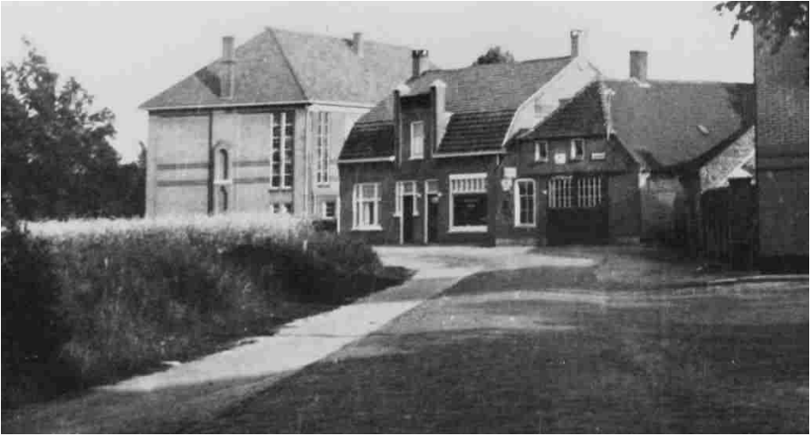
Het woonhuis en de smederij op de Dijk. Op de achtergrond de meisjesschool.