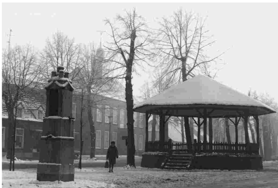
Winters beeld met kiosk omstreeks 1960.

en het land viert het gouden regeringsjubileum van koningin Wilhelmina. Openluchttooneel en feest op de Markt. Daarbij kan een kiosk niet gemist worden.