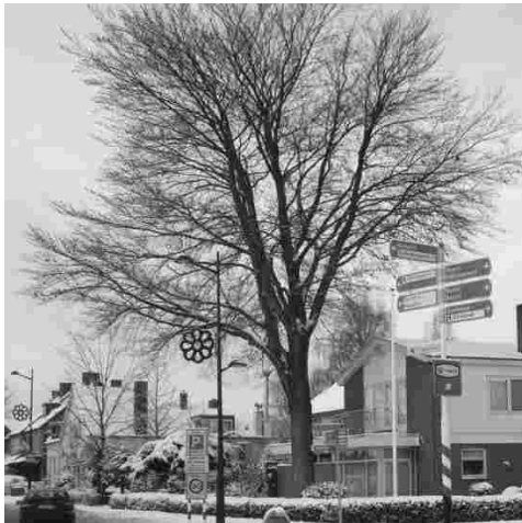
De honderdjarige beuk.