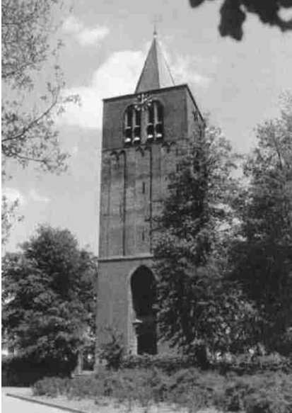
De middeleeuwse toren van Steensel