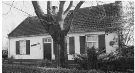
Dit huis op de Hoogstraat was ooit een van de vele kleine boterfabriekjes.