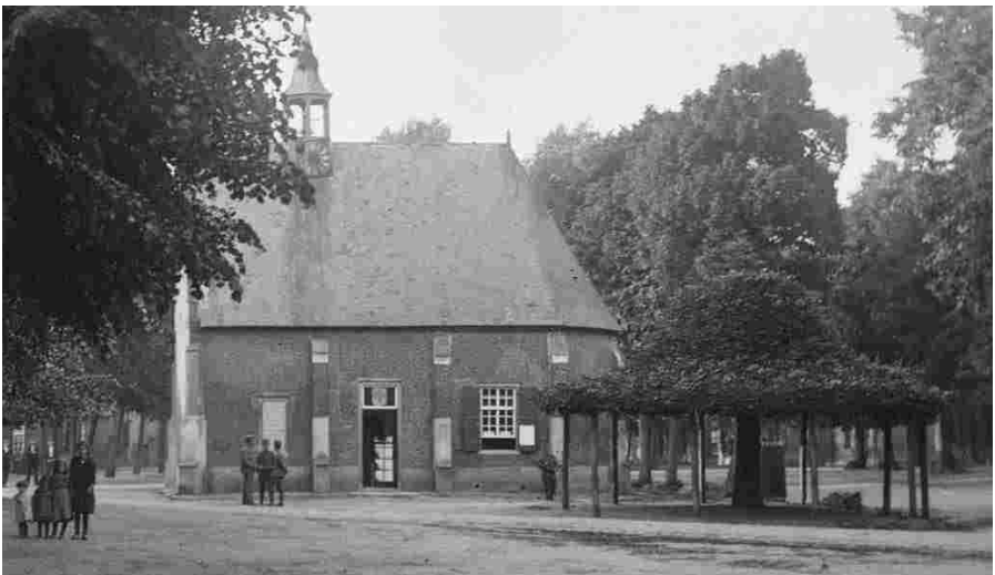
De Markt in de zomer, met fraai gesnoeide linde, kinderen en groepje militairen. De ingang is nog in de zijgevel met boven de deur het gemeentewapen. Let op de luiken aan het (opgeschoven) raam. Door de militaire aanwezigheid te dateren op 1914-18.

Wel zeker is, dat Eersel in 1544 van keizer Karel V - vader van de hier zo berucht geworden Philips II - toestemming krijgt om een wekelijkse markt op woensdag te houden en ook een jaarmarkt. 2 Dat recht is later bevestigd en vernieuwd door de Aartshertogen Albert en Isabella van Oostenrijk in 1613. Latere stukken geven aan, dat er nog in de loop van de 16de eeuw een weekmarkt en niet minder dan zes jaarmarkten plaats-