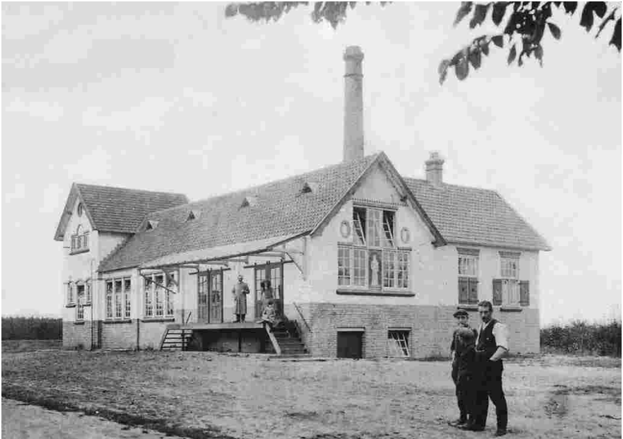
Melkfabriek Sint Benedictus in Eersel ca 1915. Let eens op de grote open ruimte eromheen.

Voor inwoners van de gemeente was de huisnummering ook bepalend voor een plaats op de markt. Die kon uiteraard gunstig of minder gunstig zijn. Op een warme dag, met boter bij je, is de schaduw van de linde bij de kapel stellig een van de beste stekken. Die leeft dan tot in onze dagen verder als de "boterlinde".