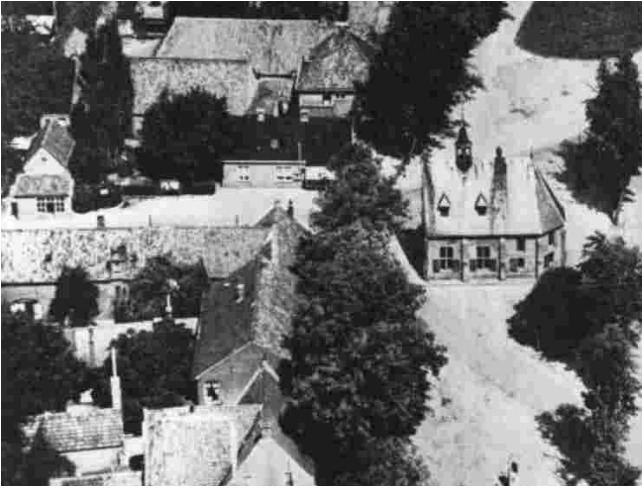
Op de voorgrond de bomen van de Markt westzijde. Links is de Duizelseweg nog zichtbaar.