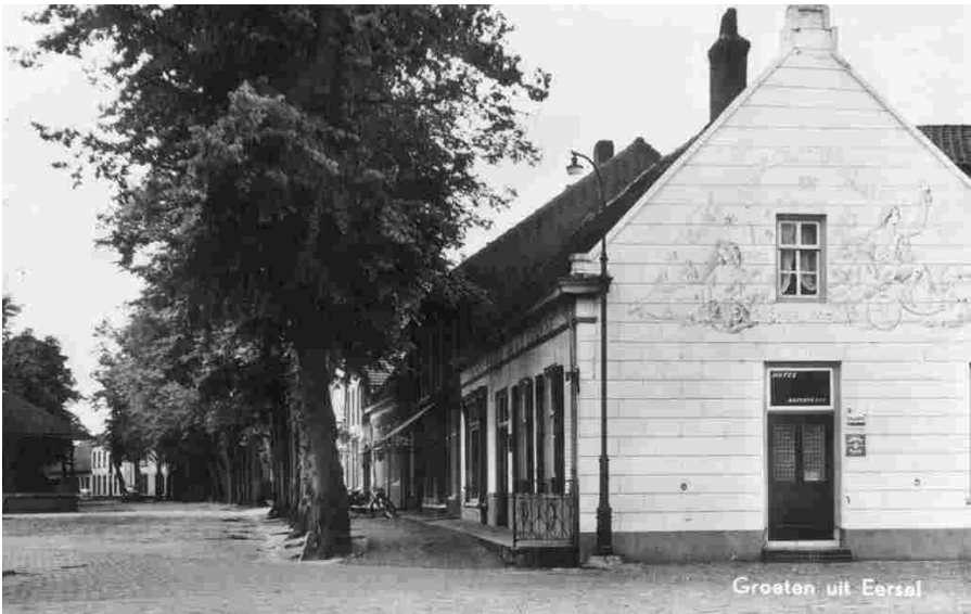
De voorheen nog beschilderde zijgevel en het vooraanzicht als Hotel-Café-Restaurant "De Acht Zaligheden" na renovatie omstreeks 1954.

In juli 1939 verhuist Leonardus met zijn gezin naar A153a. Tien jaar later wordt het Duizelseweg 12. Het is een nieuw huis, het eerste dat gebouwd