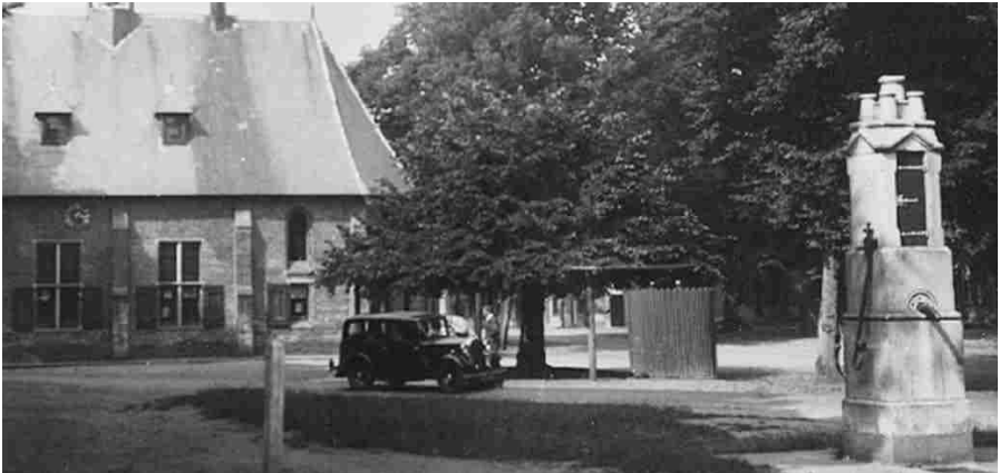
De Markt, vermoedelijk jaren '30-'40. Direct rechts van de auto de boterlinde met vlak daarbij het toenmalige, sinds lang verdwenen urinoir.

Ter verduidelijking: De verharde weg over de Markt liep toen vanaf de hoek met de Nieuwstraat [Van Huijkelom] rechtdoor tot het einde bij de splitsing Dijk/Postelseweg [Moors]. Tevens kon men toen ook vanaf de hoek Markt/Duizelseweg [Timmermans] over een net zo hobbelig stukje keienstraat schuin op die rechtdoor gaande weg uitkomen. Daarmee lag de raadhuis-kapel op een soort driepuntig eiland en daarop stond ook de (boter)lindeboom. Op de uiterste punt een (rode) pissoir.