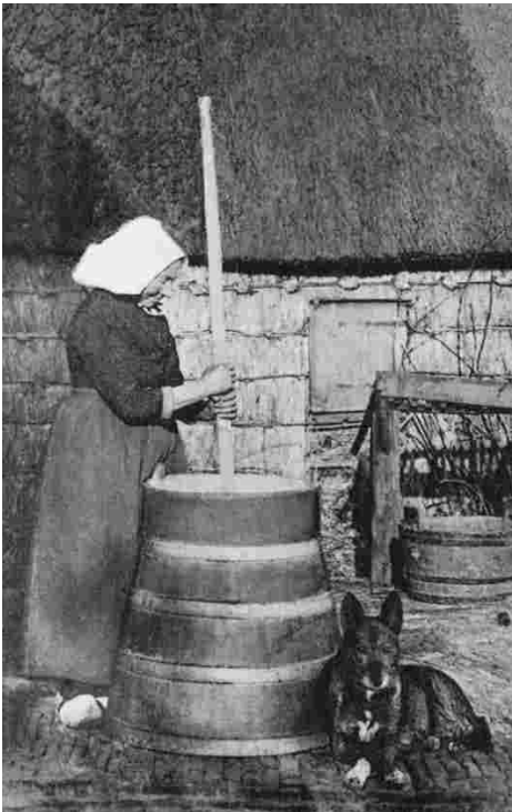
Het oude karnen van boter in de eenvoudige karnton, zoals het tot het eind van de 19de eeuw overal gebeurde.

Van de bepalingen springen er twee in het oog: hoe de verkoop moet gebeuren en in welke volgorde. De verkoop zal zijn per half Nederlands pond bij afslag en mijnen. Bepalend daarbij is de