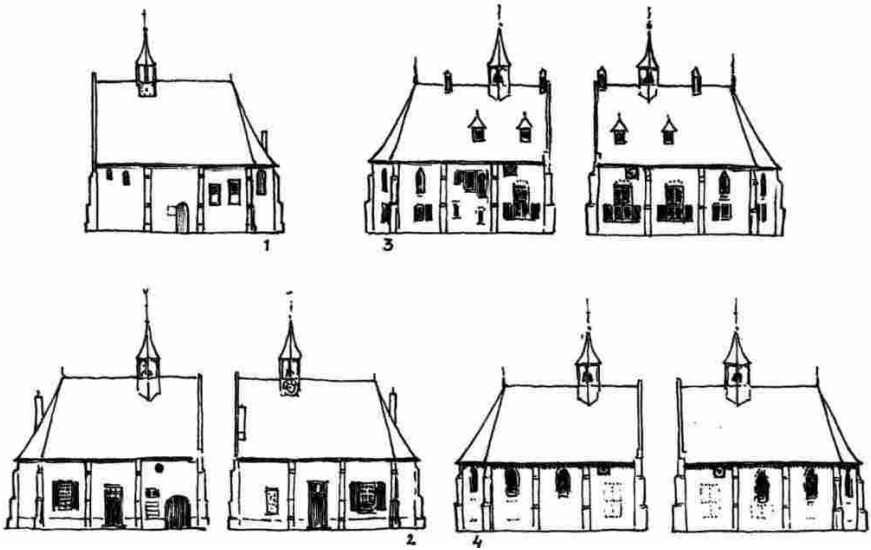
De verschillende 'aanzichten' van de kapel vanaf 1788 (tekening van Ben Sebregts in Eersel .... 'n Zaligheid. Eersel 2006)

De hulp die de pc kan bieden om wat meer bijzonderheden uit archieven op te duiken, kwam ter sprake in Rosdoek 157. Interessant genoeg voor eerste kennismaking, maar voor het echte speurwerk moet je natuurlijk de oorspronkelijke stukken bekijken. In tegenstelling tot de vroegste schepenregisters uit de 16de eeuw, zijn die van een eeuw later in het algemeen wel wat gemakkelijker te lezen. Maar de meestal korte omschrijvingen van documenten in BHIC, smaken soms al naar meer. Een voorproefje.