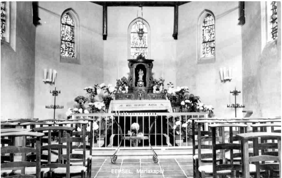
Het interieur van de kapel in 1958