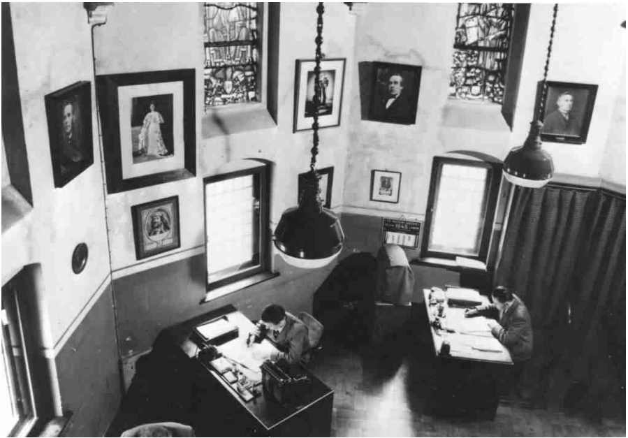
Het interieur van het gemeentehuis in 1956