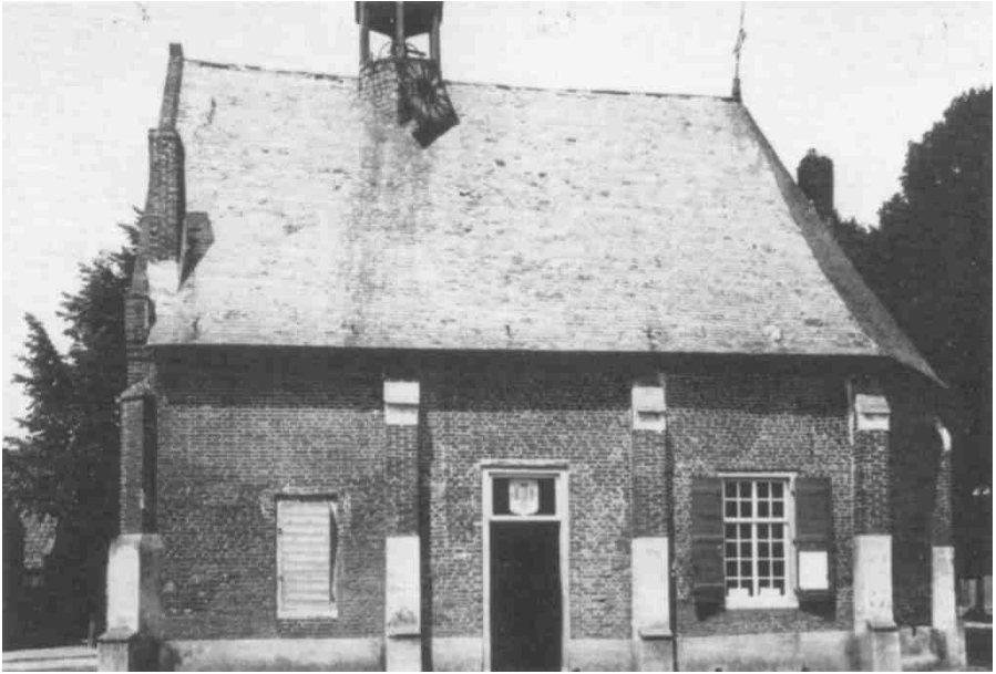
Zuidgevel van de kapel als raadhuis (foto uit 1918)