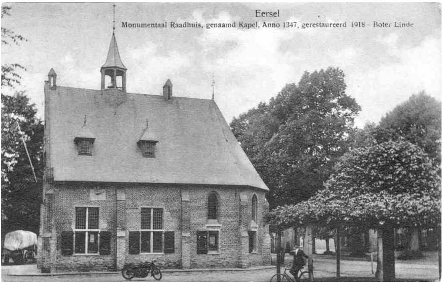
De kapel als gemeentehuis na 1919 (foto uit 1920)