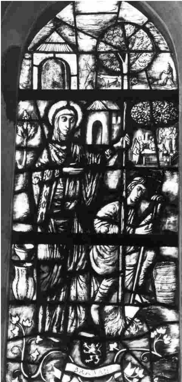
Raam Sint-Odrada (zwart-wit foto van Gaston Remery)