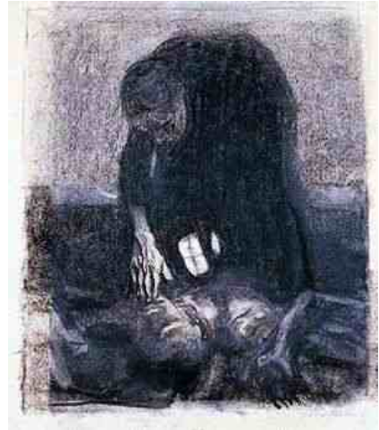
Slachtfeld Käthe Kollwitz, 1907

een weinig geordend en gedisciplineerd beeld, laat staan van de spreekwoordelijke Duitse Gründlichkeit, roept dat op. Ook een legrapport ontbrak. En daarmee ook de mogelijkheid van een vergelijking van aantal gelegde en geruimde mijnen. Zoals niet zelden wordt een mijnenveld daarmee een boemerang en de ironische zelfbetiteling van Himmelfahrt-kommando snel realiteit.