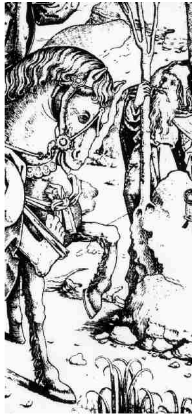
Cucufas achter de boom