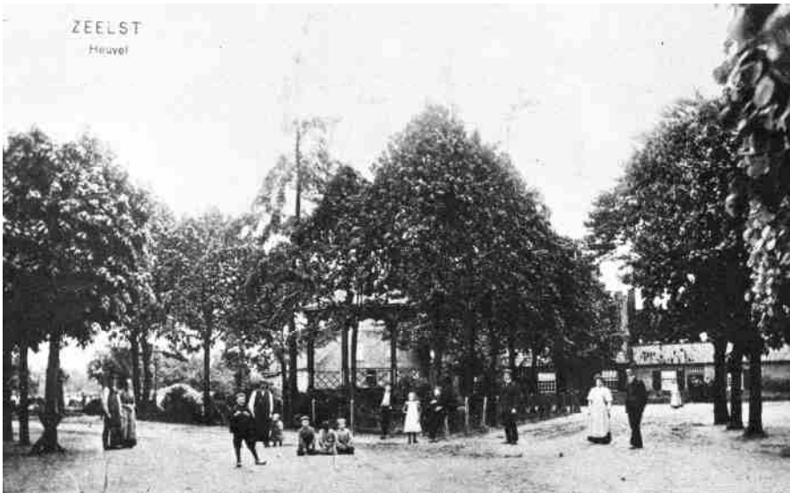
De kom van Zeelst rond 1900

Sommigen zullen bij dit verhaal de schouders ophalen. ‘Niks bijzonders, want op die manier wordt de politiek al eeuwen bedreven’, zo luidt misschien hun onverschillige reactie. Maar, als het je eigen historie betreft, die van je eigen dorp, dan, ja dan ligt de zaak toch even anders...Dan komen de feiten onder een vergrootglas te liggen. Bijna een eeuw later zal de invloed ervan zowel in positieve als in negatieve zin nog merkbaar zijn.