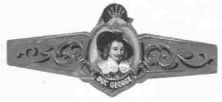
Sigarenbandje als camouflage

Vanaf 1921 komt daar nog bij dat zo'n bandje een goede mogelijkheid biedt om de banderol (belastingbandje) van de afzonderlijk verpakte sigaren te camoufleren. Zo groeit het sigarenbandje uit tot een belangrijk middel in de steeds feller wordende concurrentiestrijd. Een fraai sigarenbandje blijkt bij uitstek geschikt om de sigaren inclusief het merk een voornaam en chique uiterlijk te geven.