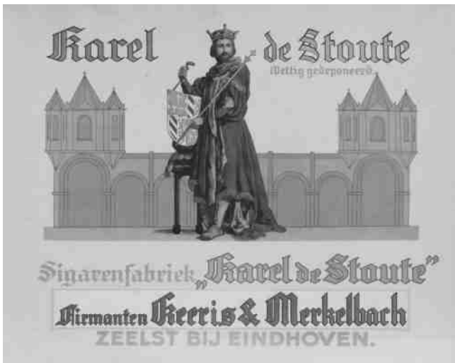
Het beeldmerk van Karel de Stoute