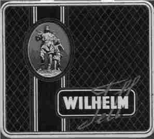
Blikken sigarendoos van Wilhelm Tell