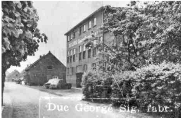
Het pand op de Broekweg