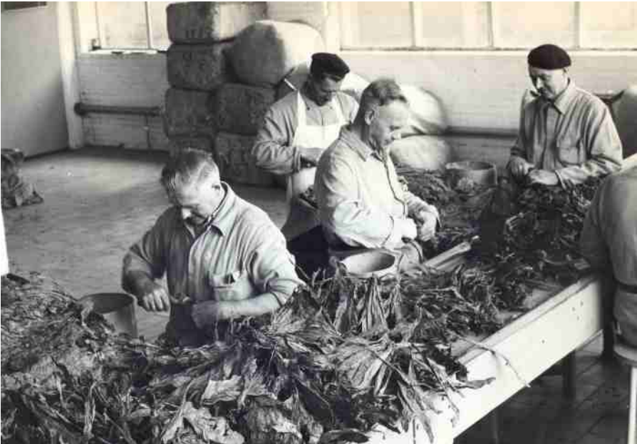
Ombladtrekkers aan het werk bij Duc George

Zo zijn ze uitgekomen bij Duc George. Aangezien deze naam, inclusief levensverhaal en beeltenis in de smaak vallen, wordt Duc George voortaan de merknaam. Via de sigarenbandjes sieren voortaan de naam en het portret van Duc George hun sigaren. Korte tijd later, in 1928, gebruiken zij de naam ook als naam voor hun nieuwe naamloze vennootschap. Bovendien prijkt de naam Duc George al vanaf de nieuwbouw op de buitenkant van de fabriek aan de Broekweg.