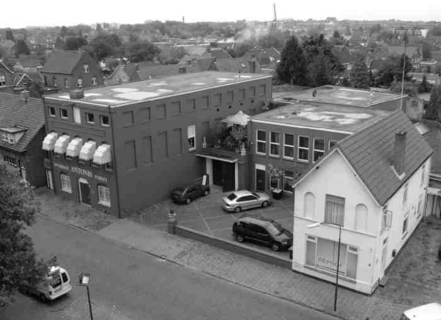
Het pand aan de Blaarthemseweg waar Bazelmans in 1900 start

Temidden van alle bedrijven en bedrijfjes ontwikkelt de familie Bazelmans zich tot de grootste sigarenproducent van Zeelst. Op een bepaald moment behoort het bedrijf zelfs tot de grootste producenten van de regio. En aangezien deze fabriek niet alleen de eerste is die wordt opgericht, maar ook één van de laatste die zijn poorten sluit, is ze met de ruim 60 jaar tevens de sigarenfabriek die het langst bestaan heeft in Zeelst.