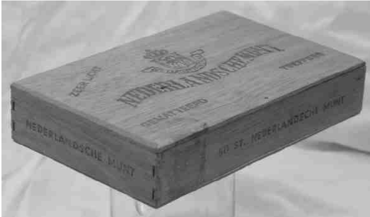
Houten sigarenkist van de Nederlandse Munt