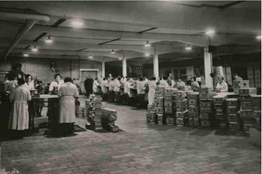
Inpakafdeling van de Duc George sigarenfabriek