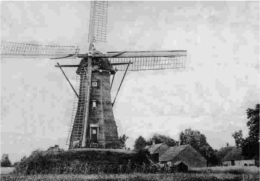
De Smalle Juffer in Eersel.

Ook in deze tijd is er duidelijk sprake van concurrentie. Want in Eersel is blijkens de notulen van de vergadering van B. en W. d.d. 19 februari 1904 een tweede molen opgericht n.l. “De Smalle Juffer” - zie ook De Rosdoek 94, juni 2000-.