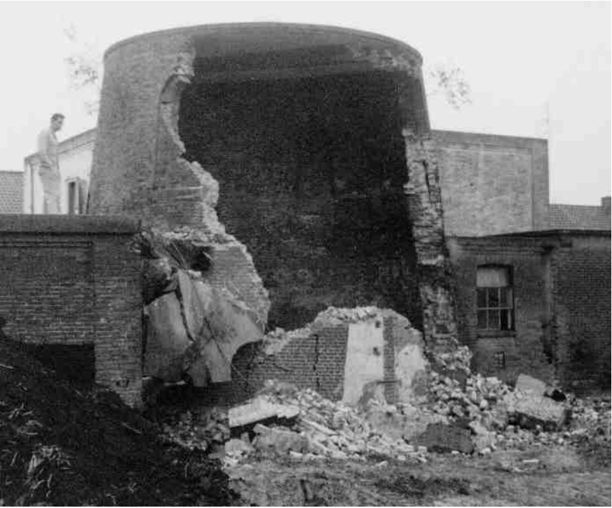
De oude molen De Run tijdens de afbraak

De molenaar moest een zware beslissing nemen, maar welke? Het gezin telde vier kinderen, drie jongens en één meisje, en ongetwijfeld zou zeker een van hen in de toekomst een gezond bedrijf willen voortzetten.