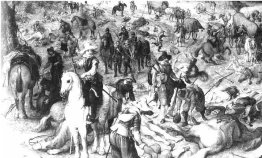
Soldaten overvallen een konvooi reizigers.

Adriaenssen vindt de verklaring van slecht betaald krijgsvolk wat te gemakkelijk en te oppervlakkig. Hij wijst erop, dat de tactiek van de ‘verschroeide aarde’ en het vernietigen van de bevolking bewuste keuzes waren om het Spaans gezinde Den Bosch op de knieën te krijgen. Een bijzonder bedreigende vorm van inbreuk op lijf en leden ten slotte, waren de vele gijzelingen.