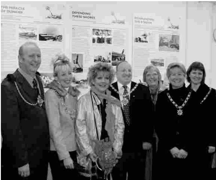
Burgemeesters op werkbezoek in Engeland