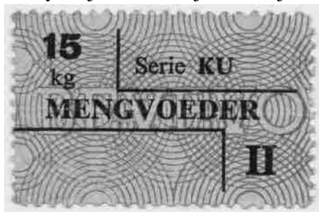
Distributiebon voor mengvoeder