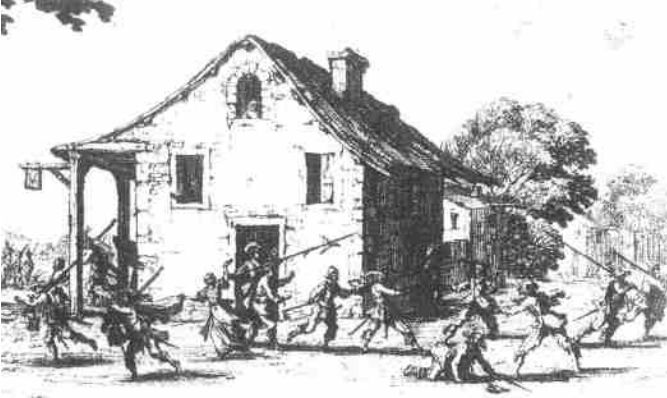
Jacques Callot Plundering van een dorp (ca. 1635).

Hoewel er in sommige dorpen toch nog enige groei zat, leidden de oorlogsomstandigheden tot massale óntvolking. Grote dorpen als Leende en Hilvarenbeek verliezen in minder dan een eeuw ruim 20% van hun inwoners, Diessen en Casteren zelfs meer dan 30%. Dan brengen Eersel en Bergeijk het er met 'slechts' 10-12% nog betrekkelijk goed van af. Misschien - zegt Adriaenssen - komt dit, doordat beide dorpen een florierende expeditie-sector van vrachtrijders hadden?