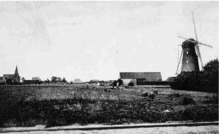
Beltmolen De Run

Sommige lezers zullen wellicht menen dat deze molen niet De Run is; zij moeten beseffen dat het dorp Eersel in 1850 slechts een zeer kleine kern had en in die dagen nog helemaal geen Schoolstraat-Runstraat-Quackelaar kende.