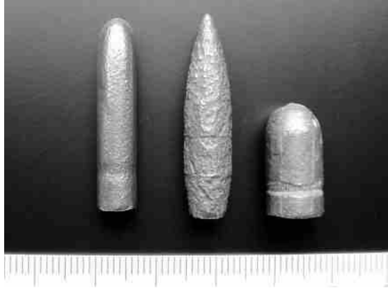
Kogels uit schietberg

Waarschijnlijk is hier bedoeld wat ook wel bekend staat als een richtcontroleur. Het gaat dan om een spiegelconstructie geplaatst op de kamer van het geweer, bedoeld voor de instructeur om te controleren of op de juiste wijze gericht wordt.