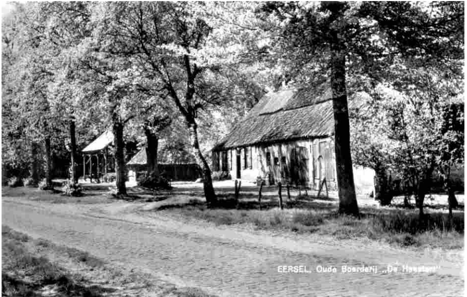
De Postelseweg ca. 1969

van zand; enz. enz. Gewoonlijk werken ze met hun drieën.