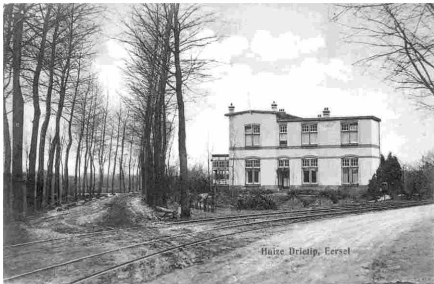
Het huis van de dokter, later domineeshuis, ca. 1917.